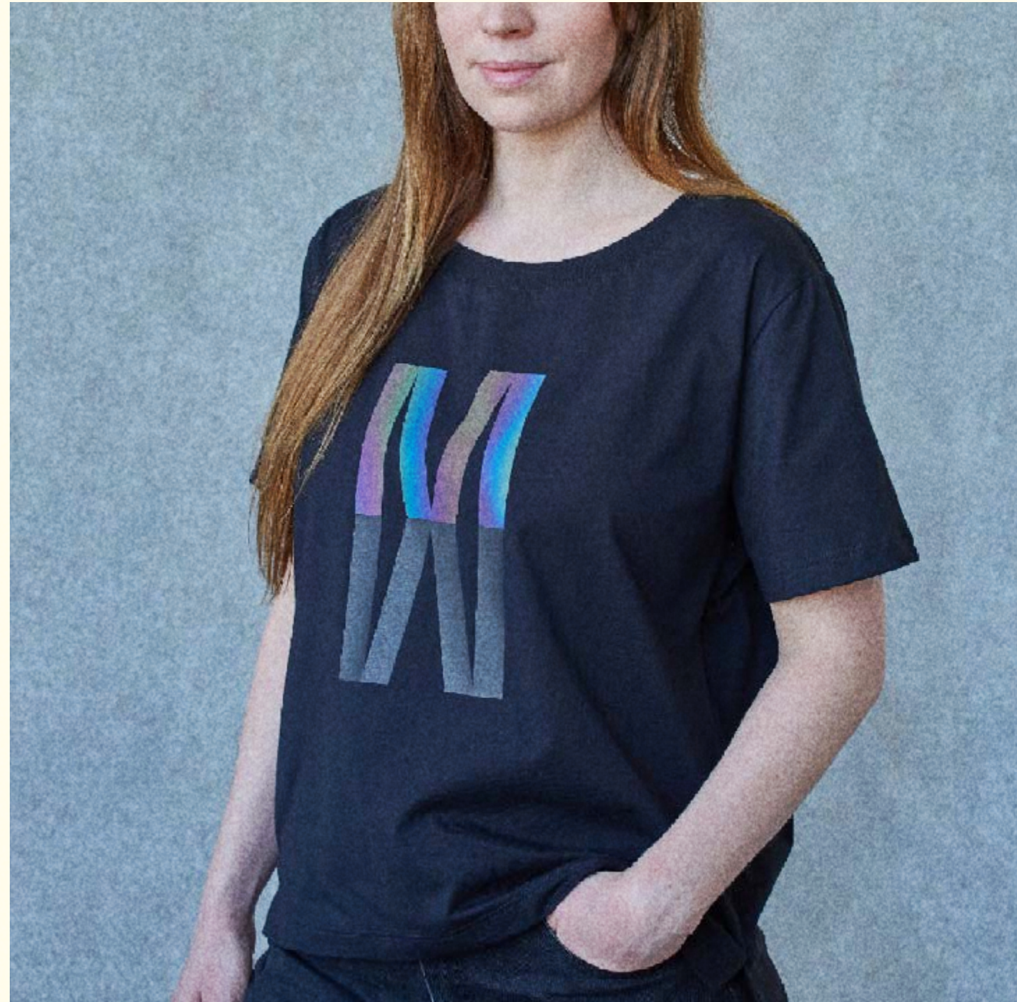
[ MOTHERMOOD KOLEKCE ] reflexní, duhová folie